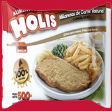
MILANESA DE NALGA/POLLO Premium x 500 Gr. Cód:28534-35