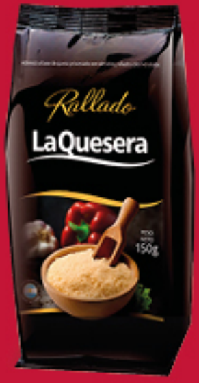
LA QUESERA Rallado x 150 Gr. Cód:1343