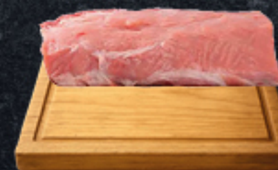
RIBS DE CERDO Congelado x Kg. Cód:28163