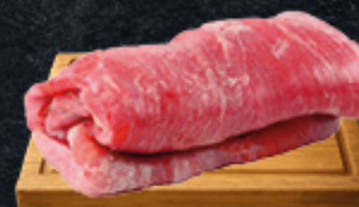
IQF Suprema Congelada x 800 Gr. Cód:45727