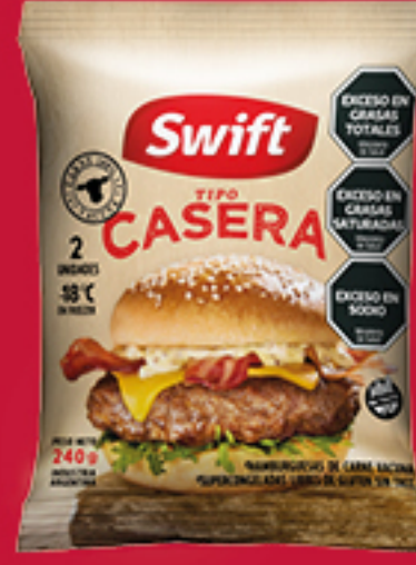
SWIFT Hamburguesa Tipo Casera 2 Un x 240 Gr. Cód:21847